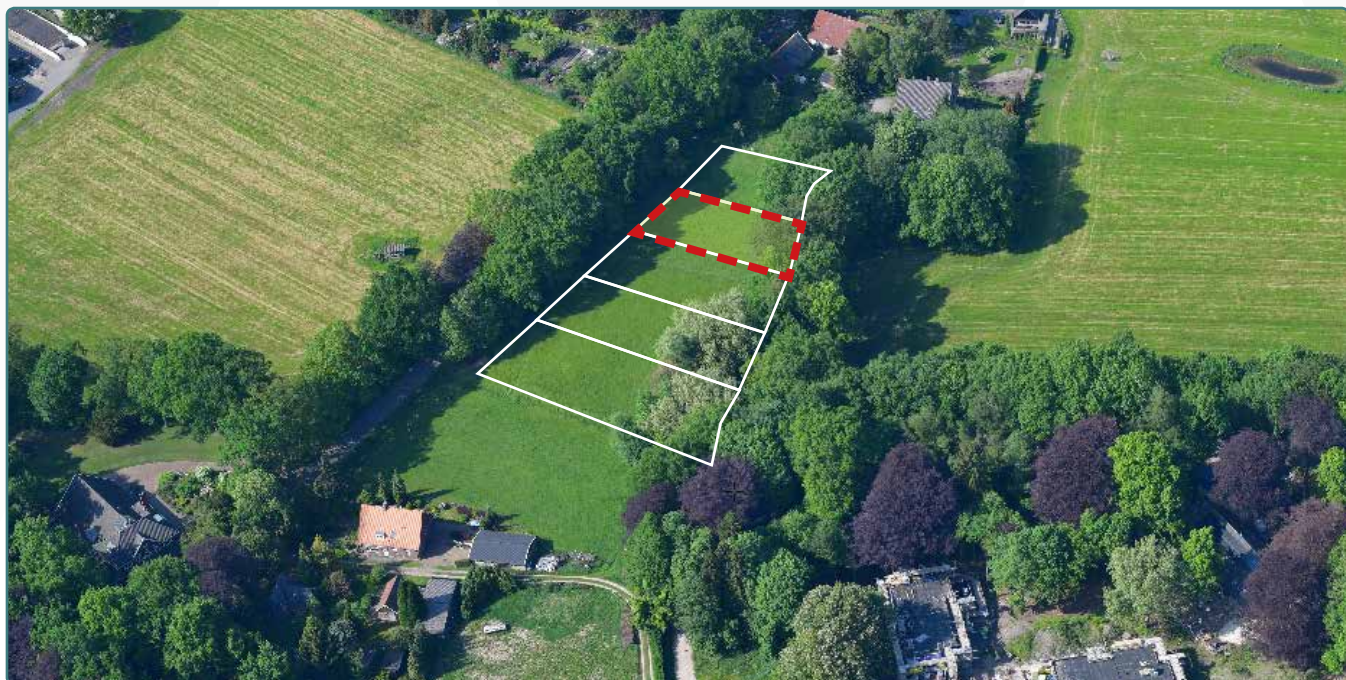
Kavel 116 vanuit de lucht