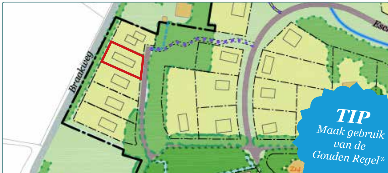
Situatietekening kavel 116