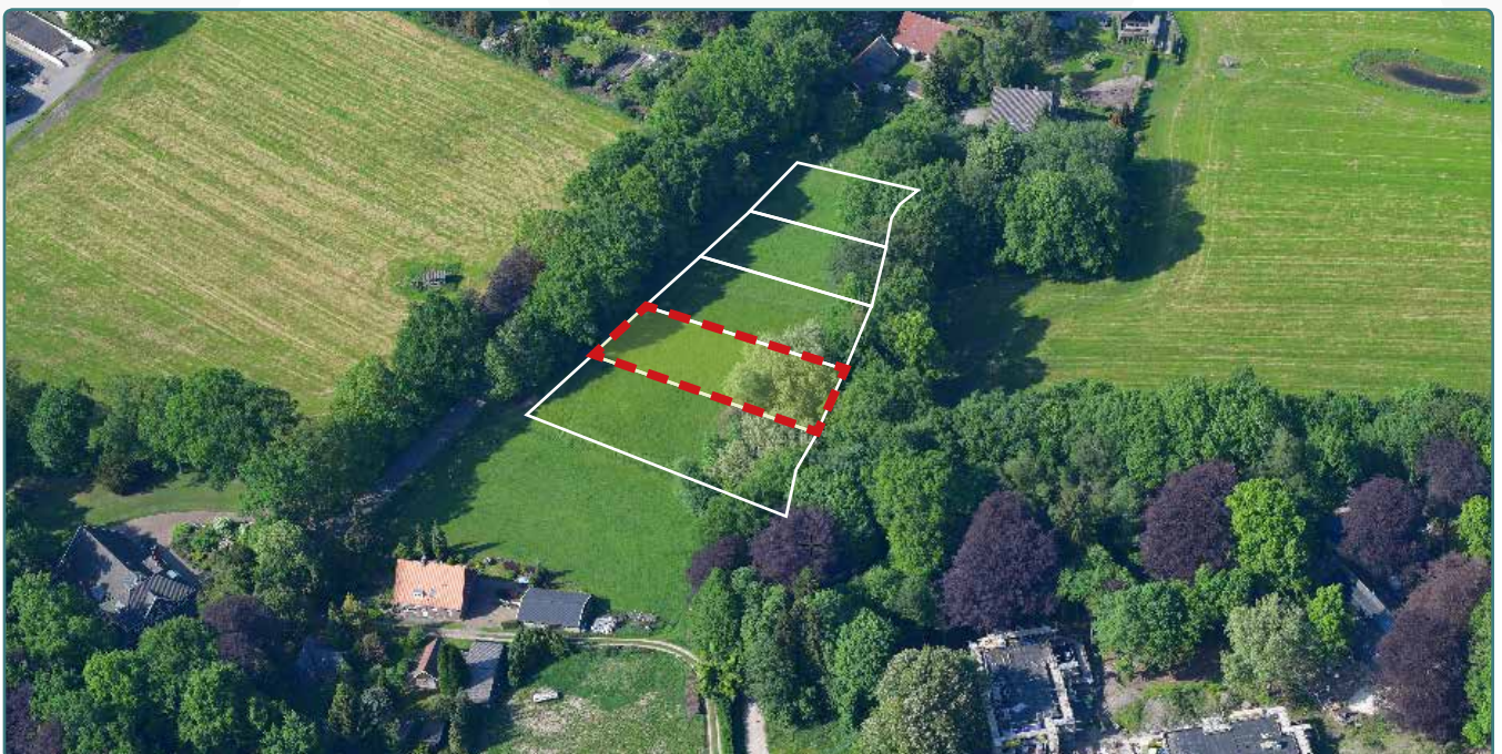
Kavel 114 vanuit de lucht