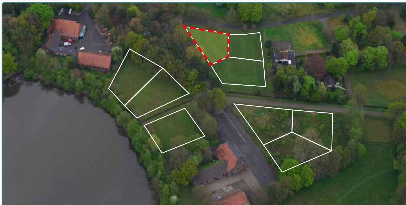
Kavel 112 vanuit de lucht