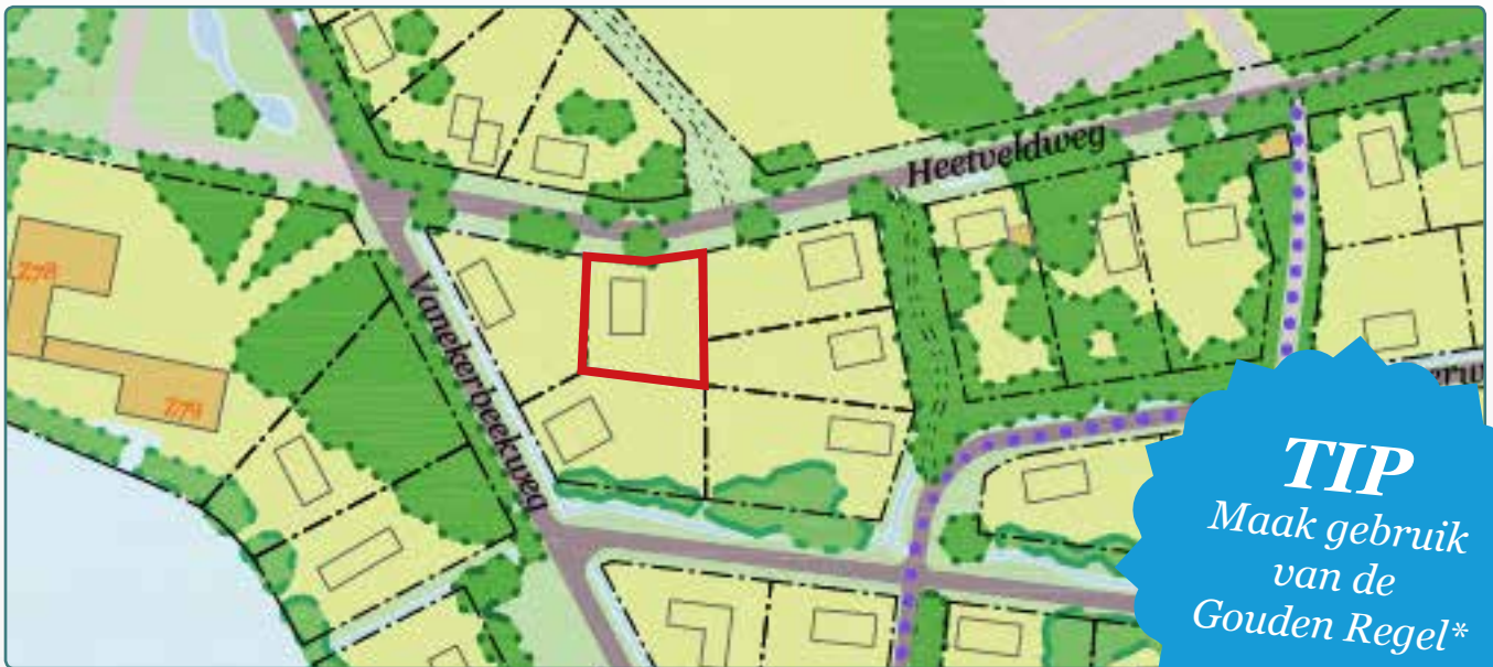
Situatietekening kavel 111