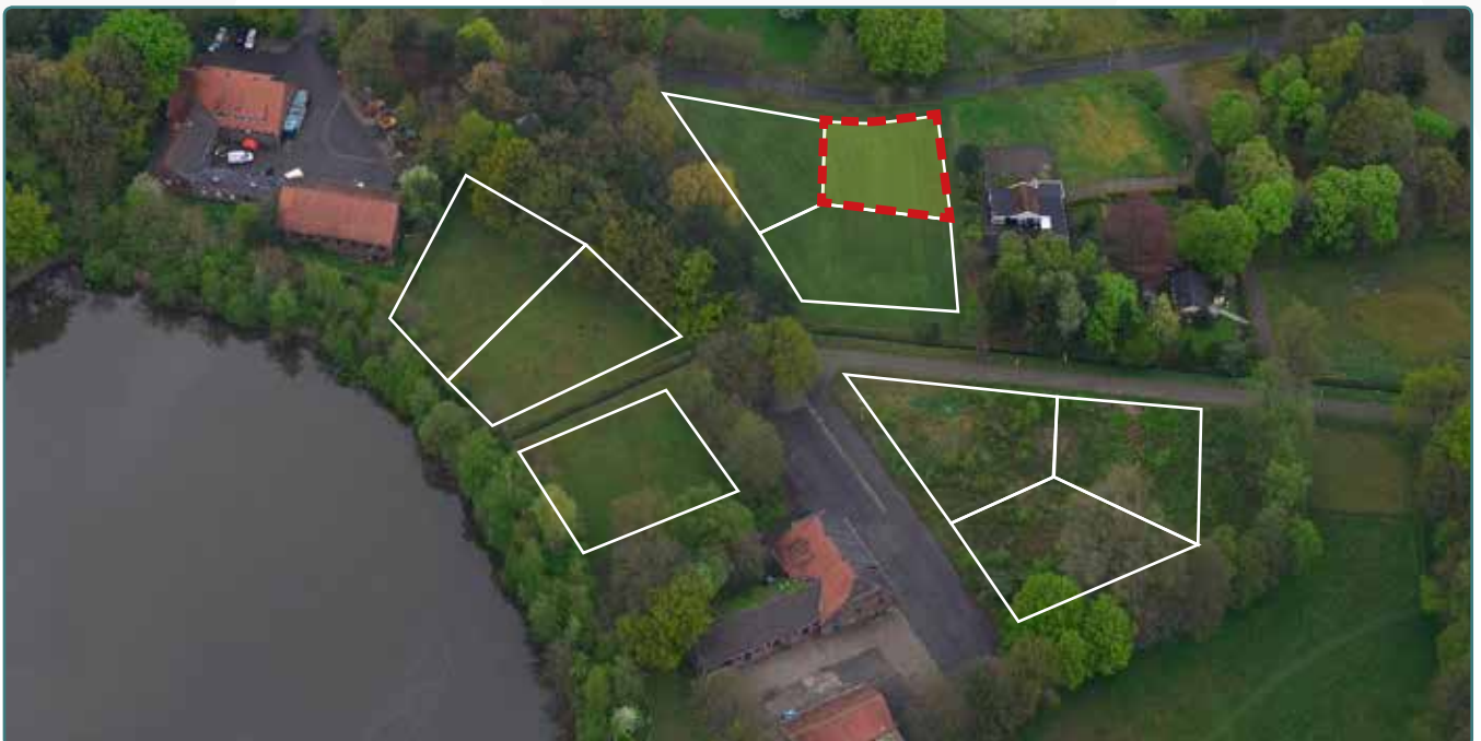
Kavel 111 vanuit de lucht