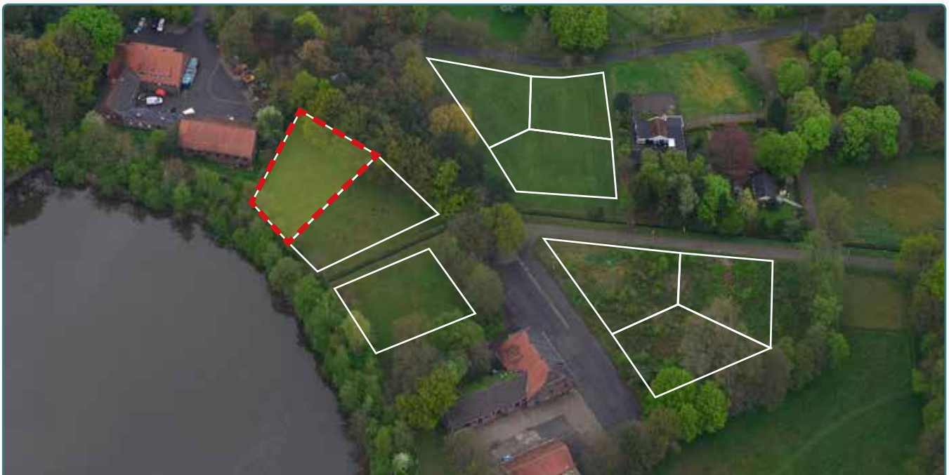
Kavel 109 vanuit de lucht