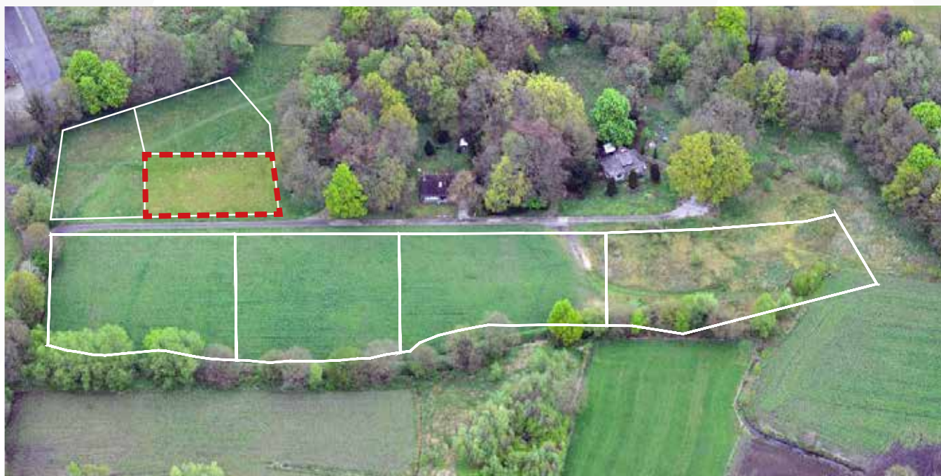
Kavel 103 vanuit de lucht