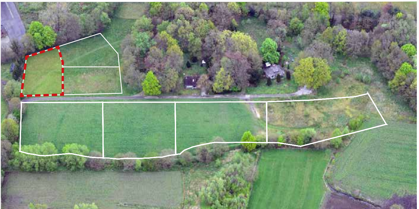
Kavel 101 vanuit de lucht