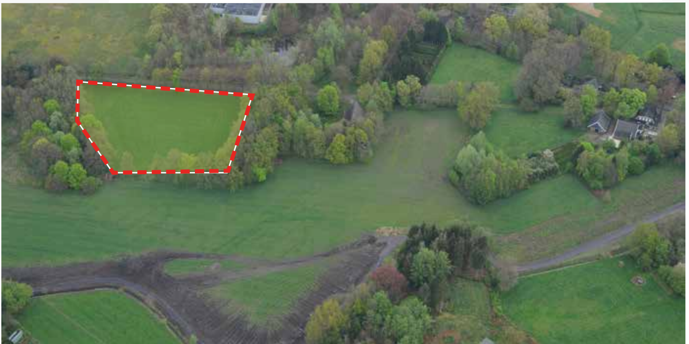
Kavel 100 vanuit de lucht