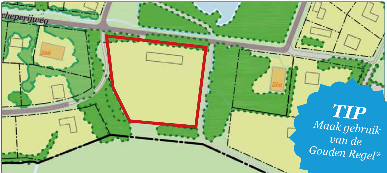
Situatietekening kavel 100